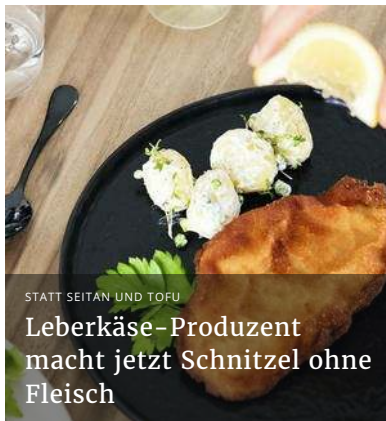
Leberkäse-Produzent macht jetzt Schnitzel ohne Fleisch