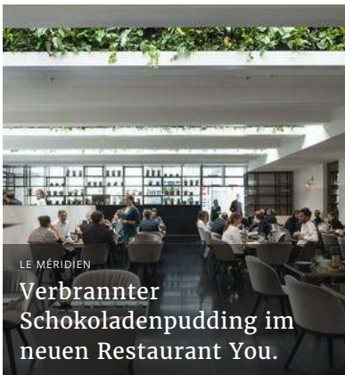
Verbrannter Schokoladenpudding im neuen Restaurant You.