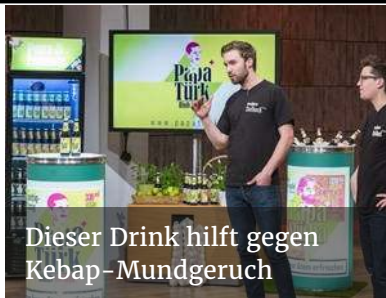
Dieser Drink hilft gegen Kebap-Mundgeruch