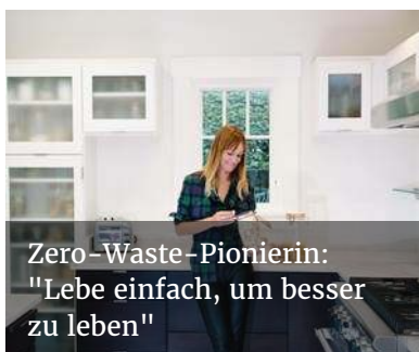
Zero-Waste-Pionierin: "Lebe einfach, um besser zu leben"