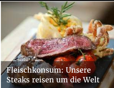
Fleischkonsum: Unsere Steaks reisen um die Welt