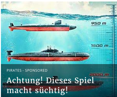
Achtung! Dieses Spiel macht süchtig!