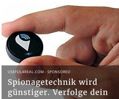
Spionagetechnik wird günstiger. Verfolge dein