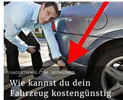
Wie kannst du dein Fahrzeug kostengünstig