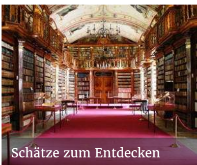
Schätze zum Entdecken